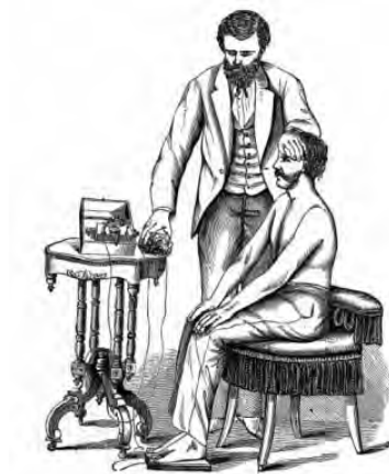
Fig. 126.—General Faradization.