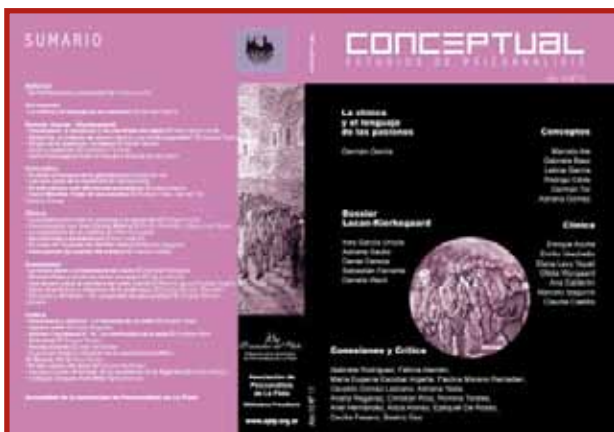
CONCEPTUAL N°1 I Revista Anual de la Asociación de Psicoanálisis de La Plata