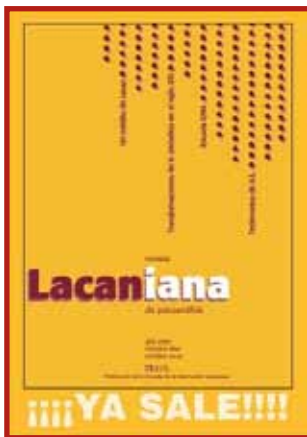
REVISTA LACANIANA DE PSICOANÁLISIS Año 7 N°10 octubre 2010 Publicación de la EOL