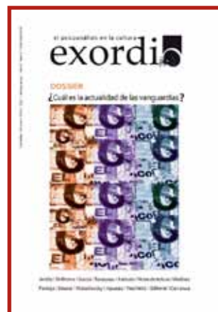
EXORDIO N°2 El psicoanálisis en la cultura Revista Anual del CIEC Córdoba