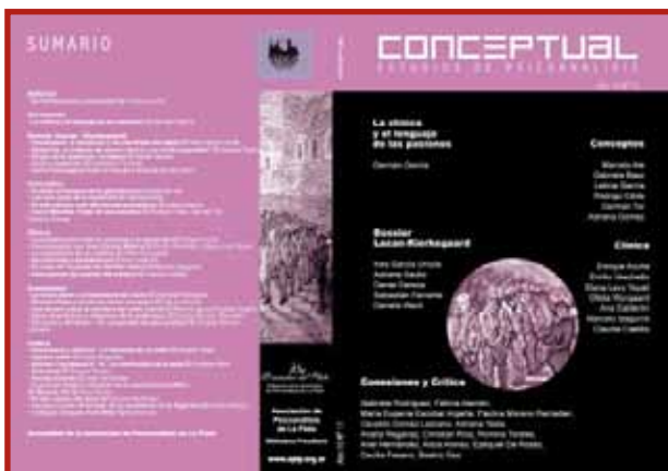
CONCEPTUAL N°1 I Revista Anual de la Asociación de Psicoanálisis de La Plata